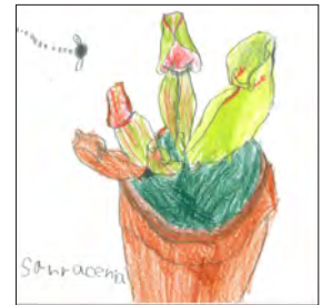
(4) おいしいハエを いただきます