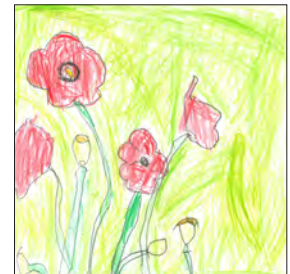
(8) きれいにさいたよ