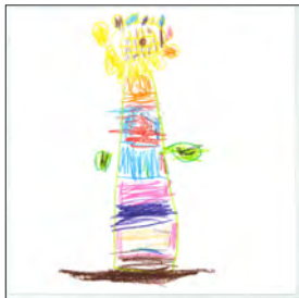
(5) ぜんこくで おおきなひまわり