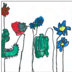
(1) お野菜、 おおきなあれ