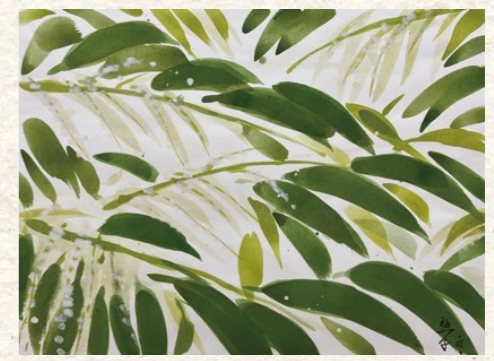
《春・夏 包装紙》2002年 エッグテンペラ、紙