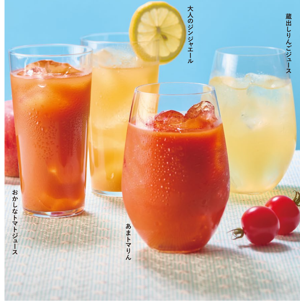
おかしなトマトジュース

恵那山ファームの甘くておいしいトマトジュースにりんごの清涼感と飲みやすさを、甘酒の優しい甘さとコクをプラスした新商品「あまともりん」が登場!砂糖は一切不使用、トマトは苦手という方やお子様にもぜひおすすめしたい自信作です。素材自慢のドリンクをギフトにもどうぞ。