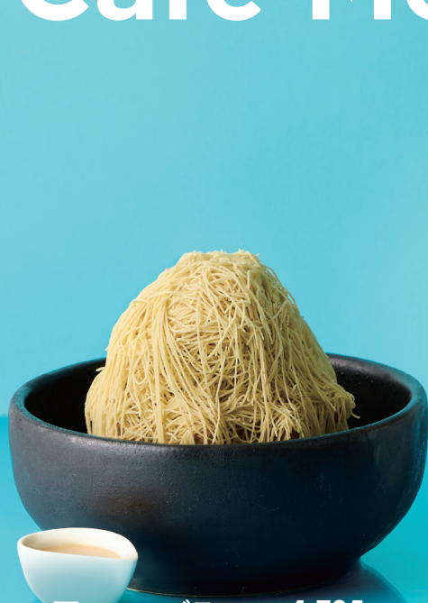
夏のモンブラン 1,705円

細く絞られたモンブランペーストの下には栗ソフトが。黒糖みつと栗きなこソースを合わせれば栗本来の甘みが引き立ちます。ワッフルコーンの中のわらびもちが和のおいしさを添えます。