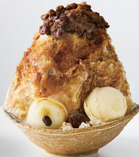
特選わた雪氷 -黒蜜きなこ- 1,430円

口に入れたらふわっと溶けてなくなるわた雪のような食べ心地の氷に、黒糖蜜と小豆の蜜煮、きなこ、栗観世、栗ソフトを贅沢にトッピングしました。