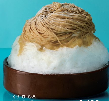
くりひむろ 栗氷室 1,430円

夏限定のモンブラン氷。モンブランペーストと、沖縄の海塩「ぬちまーす」を使った生クリーム、そしてふんわりかき氷がお口の中で溶け合います。中に特製栗シロップと小豆のみつ煮をしのばせました。