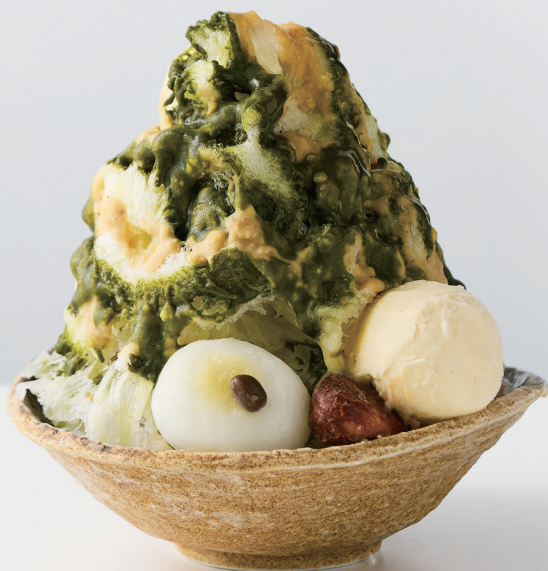
特選わた雪氷 -栗抹茶- 1,430円

口に入れたらふわっと溶けてなくなるわた雪のような食べ心地の氷に、こだわりの特製栗シロップ、抹茶シロップ、栗観世、栗ソフトを贅沢にトッピングしました。